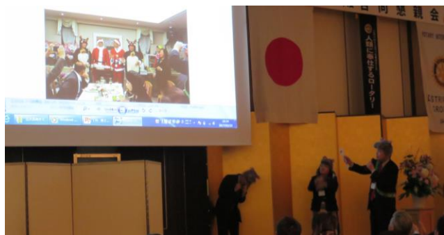
この時に大宮南 RC の歌「同じクラブのロータリアン」を披露しました。