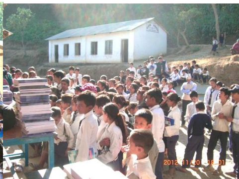
列を作って、もらう時はちゃんお礼の言葉も