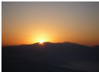
今日も1日始まります!