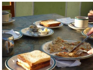
朝食はちゃんと取らないとね