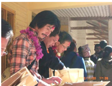
ここでも一人一人、手渡して