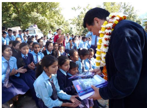
一人一人に文房具を配りました