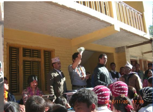
2校とも、寄付をしてきました