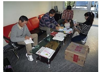
寄贈する本に大宮南RCのシール貼り