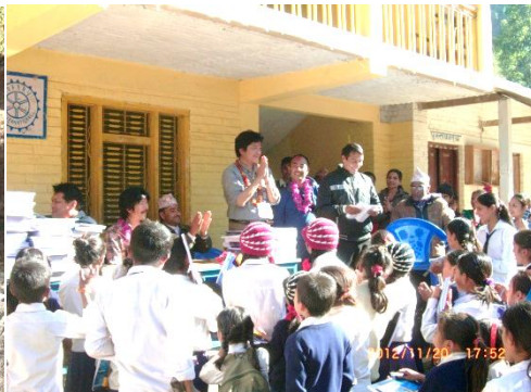
みんな、会長の話しをしっかりと聞いてます