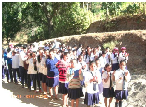
ここでも全校生徒でお出迎え「ナマステ！」