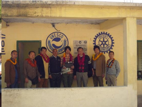
ちゃんと大宮南RCの名前がありました