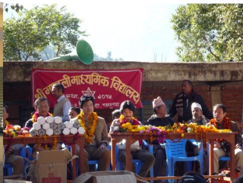
壇上で生徒たちとご対面