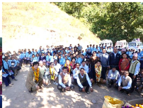
全校生徒と記念撮影