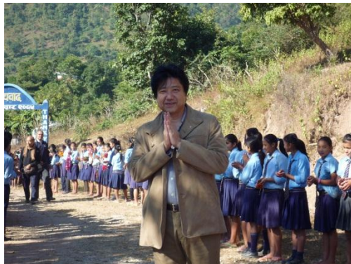
全校生徒でお出迎え「ナマステ！」