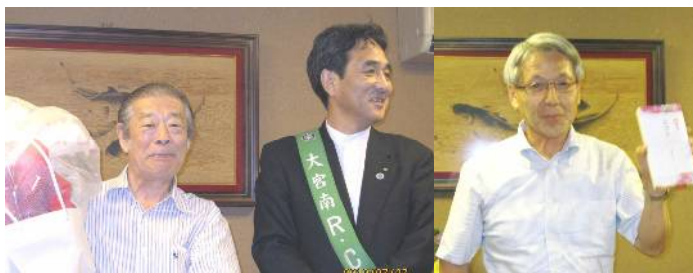
▲前年度会長・幹事へ花束・記念品贈呈