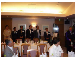
大宮シティーRCの皆様